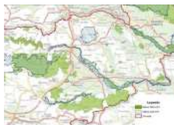
Slika 5: območje Nature 2000 v Sloveniji