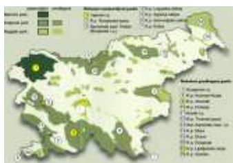
Slika 4: Narodni, Krajinski in Regijski parki v Sloveniji